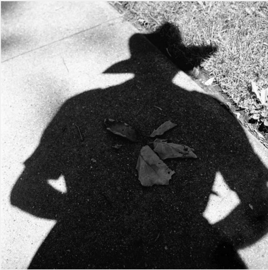
Vivian Maier, Autoportrait

En attendant l'exposition du Jeu de Paume à Tours , on peut découvrir la photographe inconnue Vivian Maier (la nounou photographe en secret) sur le stand de la galerie Les Douches : révélation soudaine d'un corpus étonnant.