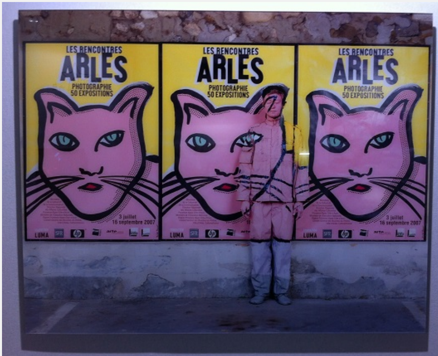
Liu Bolin, Rencontres d'Arles

Liu Bolin (même galerie), qui joue toujours à se fondre dans la réalité environnante, le fait ici en induisant discrètement une critique de l'exposition et de son marketing.